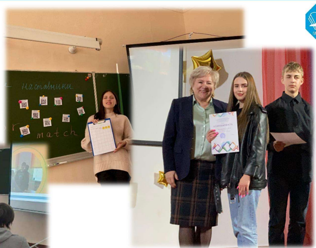
Награждение лучших наставников по итогам учебного года