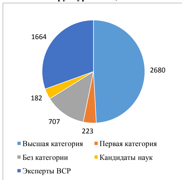
Структура ООП, часы