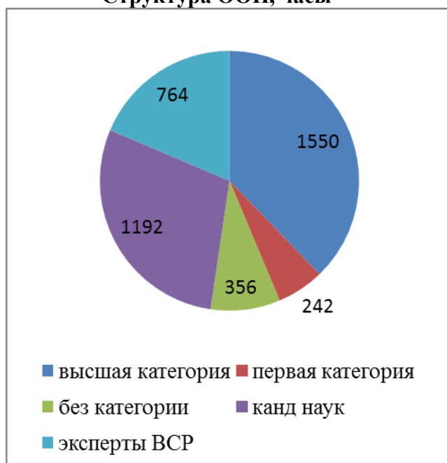
Структура ООП, часы