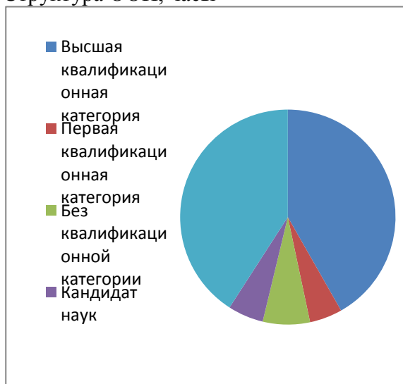
Структура ООП, часы