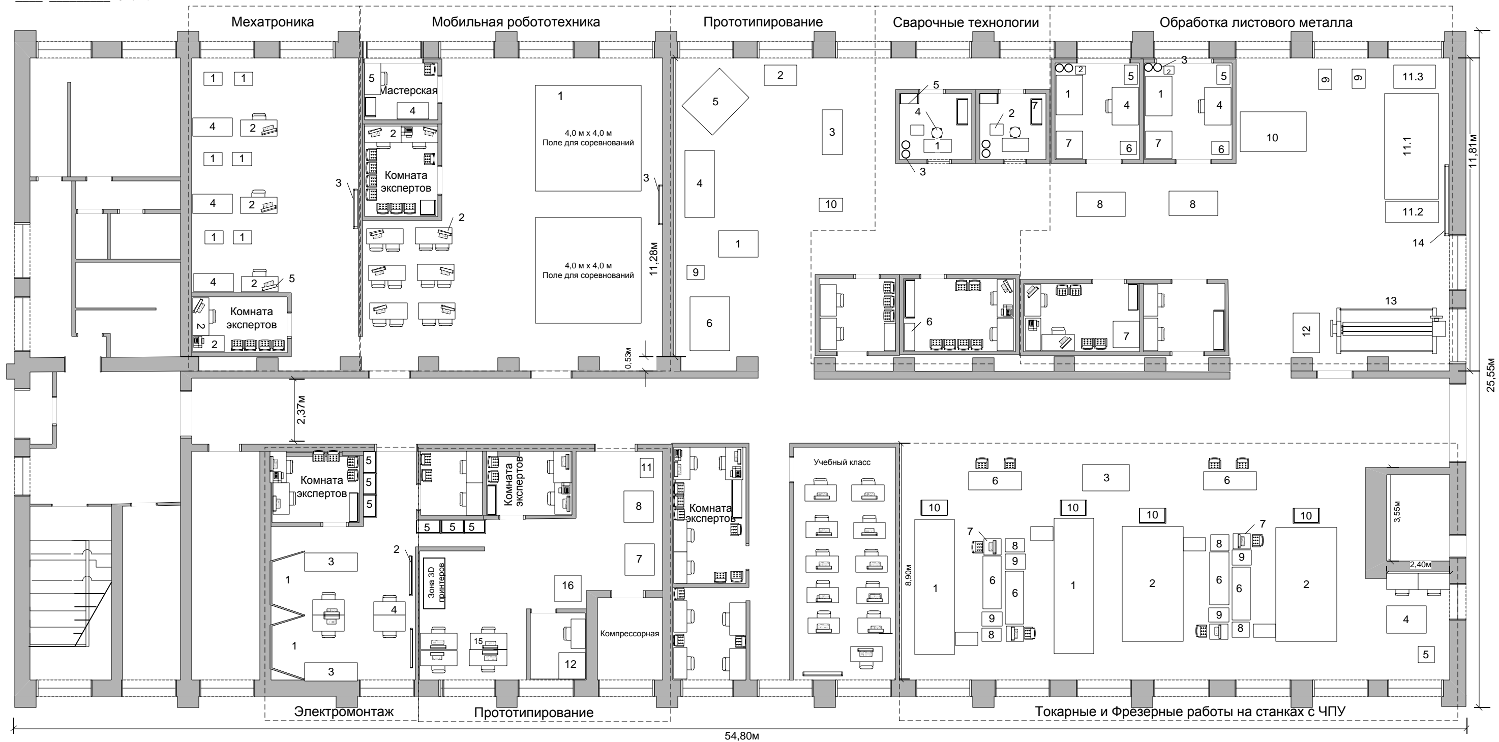
ПЛАН размещения оборудования на площадках тренировочного полигона (масштаб 1:145мм)